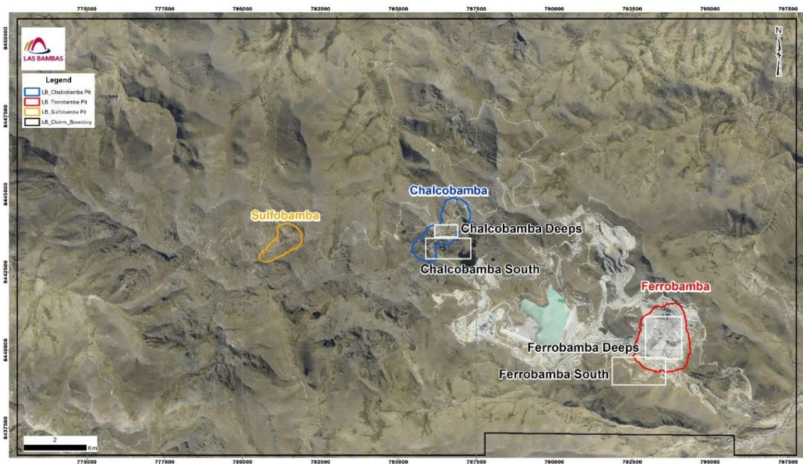
圖 1：Las Bambas 儲量及資源量位置採礦特許權及 Ferrobamba 深部、Ferrobamba 南部、Chalcobamba 深部及 Chalcobamba 南部勘探區簡圖。

在 Ferrobamba 南部完成了四個鑽孔（590 米進尺），目標為 Ferrobamba 侵入體南部邊緣的矽卡岩礦體。有待樣品化驗結果返回。